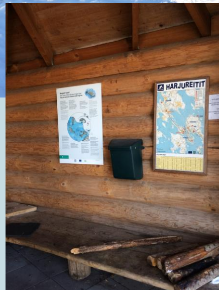
Metsähallitus / Anna Pykönen