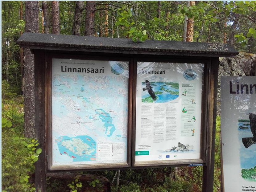
Laivalaituri, Linnansaari quay