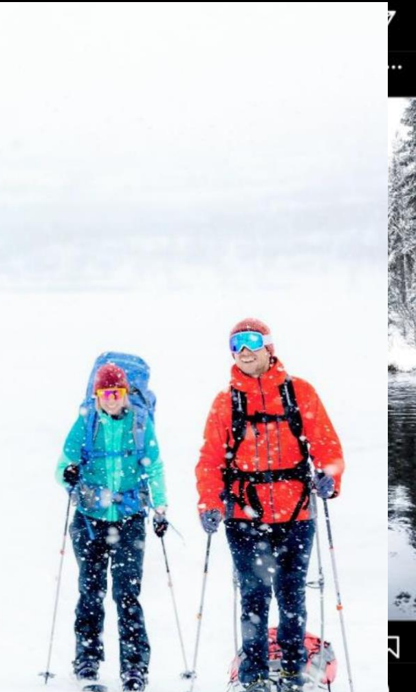
Kuva Rami Valonen