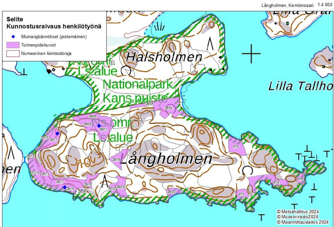
Kuva 3. Kunnostusraivauskuviot Långholmenin laitumella. Figure 3. Areas to be restored (tree and scrub clearance areas) in the Långholmen pasture.