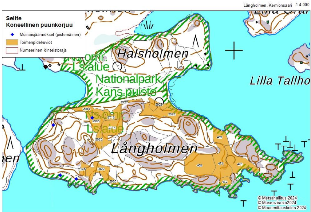
Kuva 4. Koneellisen puunkorjuun toimenpidekuviot Långholmenin laitumella. Picture 4. Action patterns for mechanized wood harvesting in the Långholmen pasture.